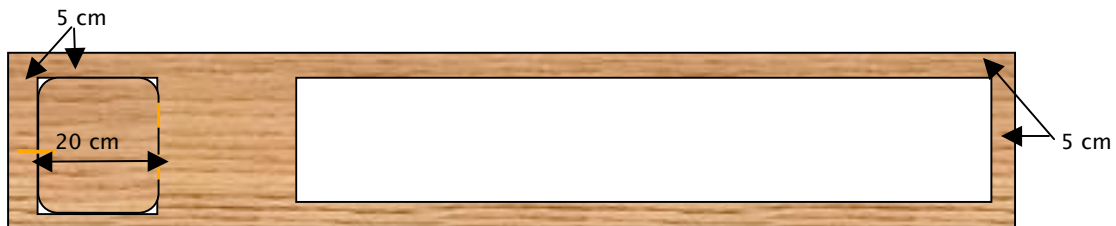
Abbildung 2: Vorderwand